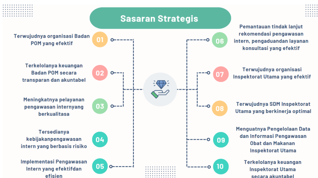
Bagan 3. Sasaran Strategis Inspektorat Utama